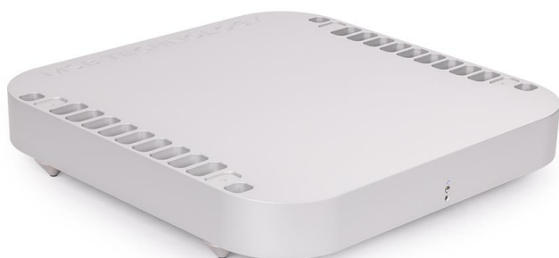
Reference Digital Director