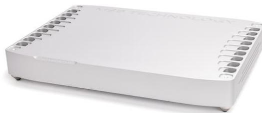
Premier Digital Director