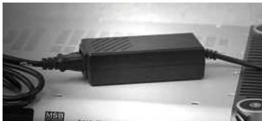
Desktop Power Supply