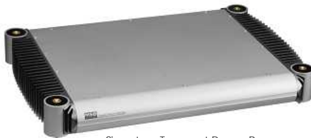
Signature Transport Power Base